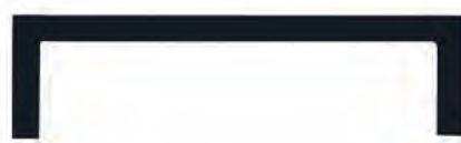
PF polku 110