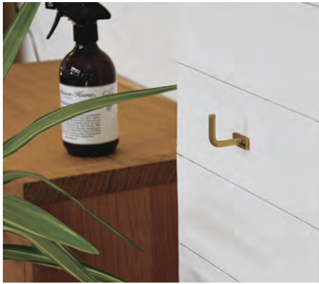
PF ranka RD