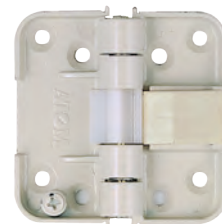
木口掘込付け丁番 (キャッチ付き、50°仮ストップ付き)