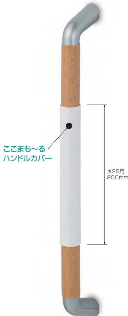
ここまも～る ハンドルカバー