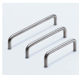
錆や薬品に強い ステンレス製品