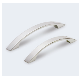
錆に強い アルミ製品