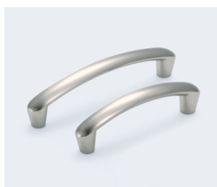
様々な形状で製造しやすい 亜鉛合金